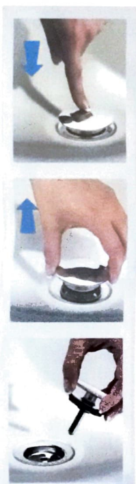
IL TAPPO no problem, che permette la chiusura con una semplice pressione digitale

Sotto. È DOTATO DI un'apertura nella parte anteriore che consente di rimuovere i residui accumulati nello scarico del sifone